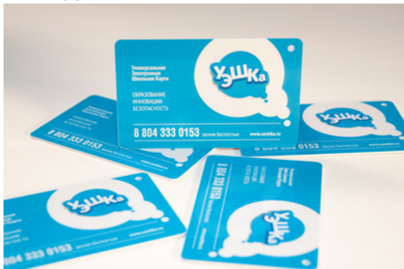
Карта УЭШКА первоначально

выдается БЕСПЛАТНО всем ученикам. Карту необходимо при каждом проходе прикладывать к считывателю турникета.